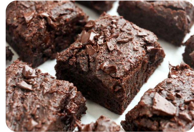
Black Bean Brownie