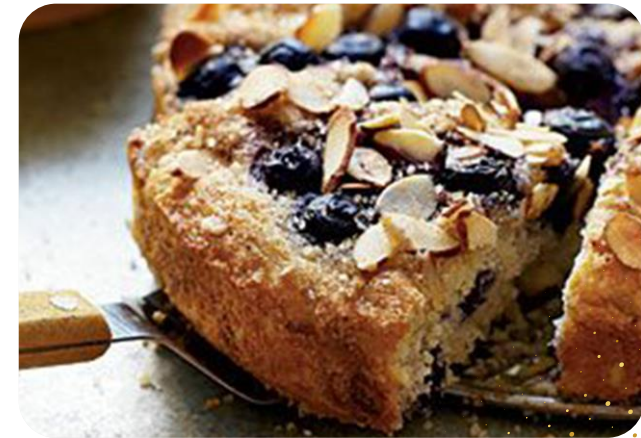
Blueberry Coffee Cake