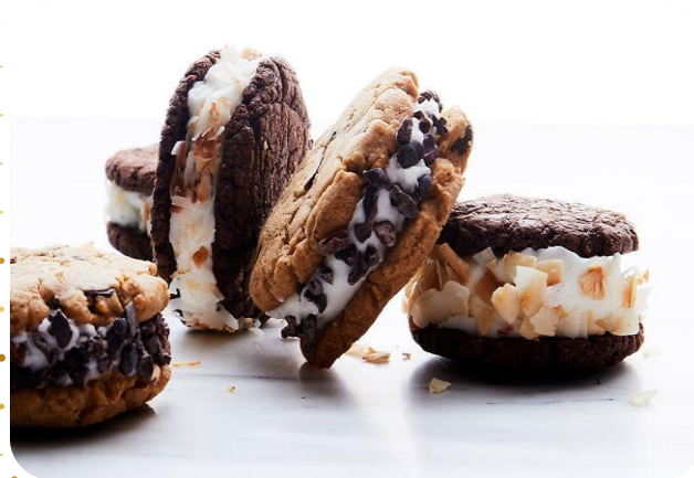
Ice Cream Cookie Sandwiches