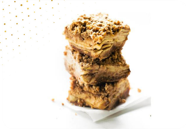
Plant Based & Apple Crumble