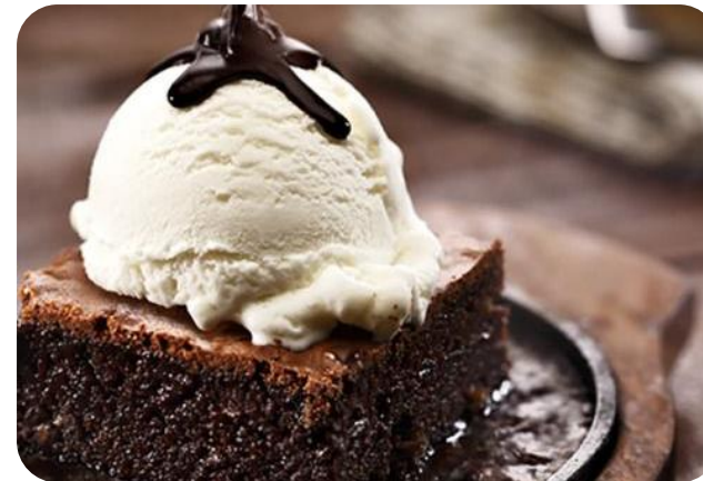
Ice Cream Brownie