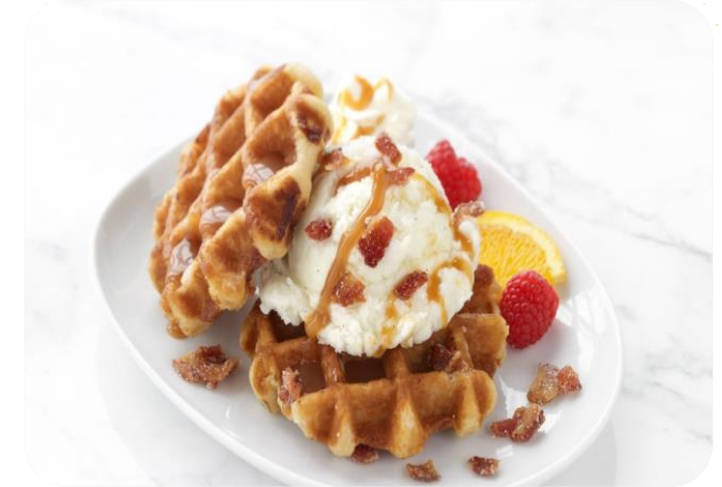
Waffle Ice Cream